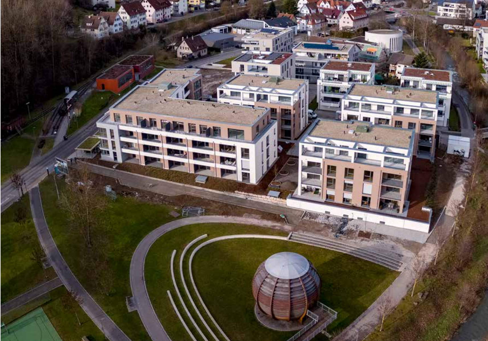
Auch aus der Vogelperspektive macht das neue Areal am Riedbrunnen eine gute Figur.