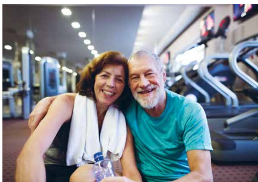
SenioPrävent hilft, gemeinsam fit zu bleiben

Die 2- und 3-Zimmerwohnungen mit Wohnflächen von ca. 55 m 2 bis ca. 107 m 2 sind interessante und renditesichere Kapitalanlagen. Käufer, die die Wohnungen vermieten, erhalten von der Stiftung Innovation & Pflege einen umfassenden und rechtssicheren Vermietungsservice. Auch dieser gehört zum umfassenden meVita-Konzept.