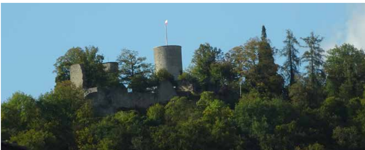
Der Blick vom „Wohnzimmer“ der Tagespflege auf die Burgruine Hohennagold, eines der Wahrzeichen von Nagold

Druckzentrum Südwest GmbH 78052 Villingen-Schwenningen